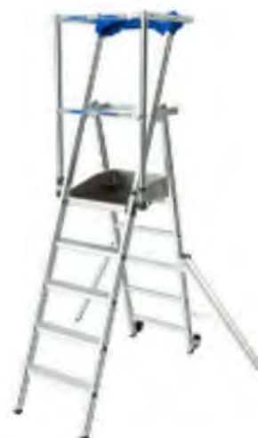
PLATE-FORME DE TRAVAIL RAPTOR

Légère et compacte elle est aussi maniable qu'un marchepied tout en permettant l'utilisateur de travailler en toute sécurité : garde-corps à 360° et plinthes intégrées. Pratique elle dispose, d'un passage WC (modèles 3 et 4 marches) et d'un porte-outil large rigide pouvant supporter un pot de peinture de 5L. conforme au décret 2004-924, à la norme EN 131-7 ainsi que, pour les modèles 2 à 6 marches, à la norme PIRL 93 353.