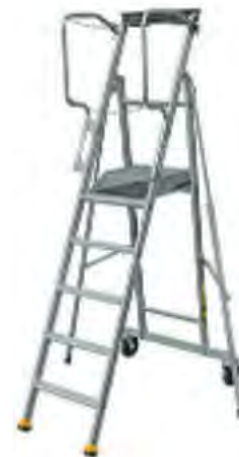
PLATE-FORME DE RAYONNAGE ALUMINIUM ERM