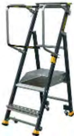
PLATE-FORME DE MISE EN RAYON STEPPER

Un équipement de travail en hauteur adapté pour un accès en rayon sans risque ni effort - Conçu en collaboration avec la CRAMIF - Installation express d'un seul geste - Déplacement aisé dans les rayons sur 4 roulettes pivotantes, inactives en position de travail - Marches antidérapantes de 100mm - Plancher anti-dérapant 0,40 x 0,50m - Larges patins anti-dérapants - Ergonomie incomparable avec porte-colis 447 x 200mm - Stabilité parfaite sans étayage - Décret 2004-924 FD EMER-E85-301.