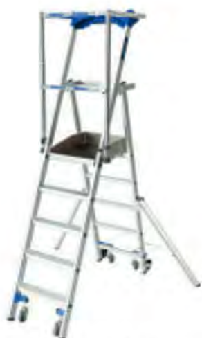
PLATE-FORME DE TRAVAIL VELOCE

La plus légère du marché version ultra-mobile. Avec ses roues escamotables, elle permet des déplacements sans aucun effort même déployée, pour aller d'une zone de travail à une autre sans être portée. Sécurisée, les 4 roues se rétractent dès l'accès à la première marche. Disponible du 2 au 7 marches. La gamme répond à la norme européenne EN 131-7, au décret 2004-924 et à la norme PIRL 93 353 (hors 7 marches).