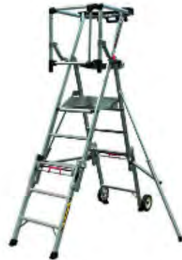
PLATE-FORME DE TRAVAIL INDIVIDUELLE ROULANTE MASTERSCOP