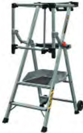
PLATE-FORME INDIVIDUELLE ROULANTE MASTERGUARD