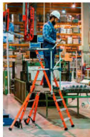
PLATE-FORME DE TRAVAIL SHERPAMATIC FIBRE ISOLANTE

Structure fibre de verre résistante - Garde corps rigide antichute revêtu d'une protection rilsanisée - Plateforme bois 600 x 420 mm antidérapante avec plinthes hauteur 100mm et 3 côtés - Roues Ø 160mm - Charge maxi 150 kg - Norme 93 353 - Décret 2004-924 - Garantie 5 ans. Deux roues gros diamètre pour faciliter la mobilité.