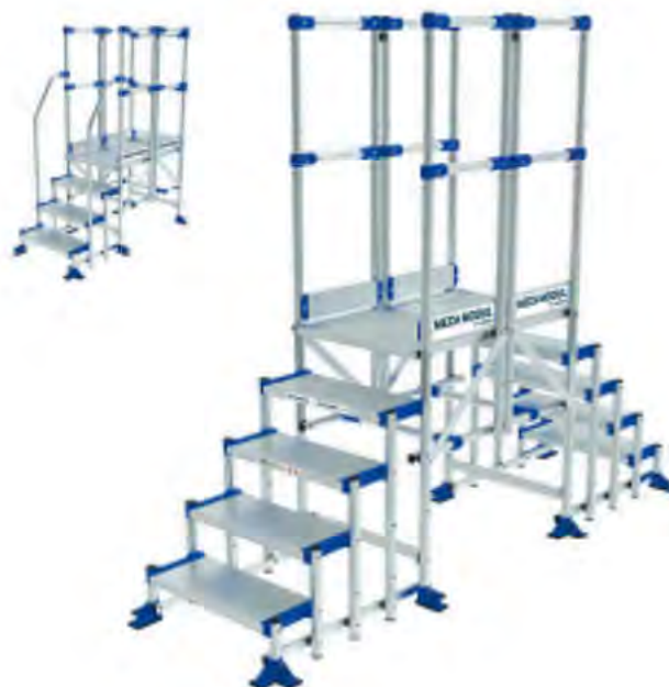
PLATE-FORME DE TRAVAIL MECA MODUL

Passerelle Meca Modul 1 mètre de plateforme.