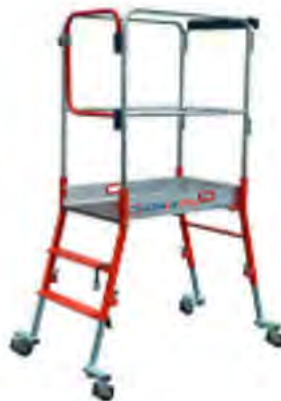
PLATE-FORME INDIVIDUELLE GAZELLE RS

1ère PIRL hyper-mobile à hauteur réglable. Acier/alu. Autostable. 3 hauteurs de travail : 2,60 m - 2,70 m - 2,80 m. 4 pieds réglables indépendamment. Tablette porte-outils. Roulage possible en position ouverte pour faciliter les déplacements. Sous le poids de l'opérateur, la gazelle se met solidement en appui sur ses 4 patins. Protection complète de l'opérateur. Portillon d'accès à fermeture automatique. Passe les portes de 0,83 m. Décret 2004-924 - Norme PIRL.