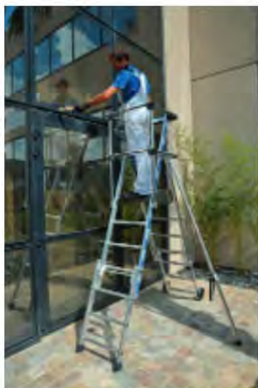
PLATE-FORME DE TRAVAIL SHERPAMATIC FIXE

Usage intensif - Utilisation sol plat - Grand confort de travail - Résistance accrue - Plateforme 600 x 420 mm équipée de 3 plinthes 100 mm - Marches 80 mm - 2 roues diamètre 160 mm - Conforme Norme PIRL 93353 - Décret 2004-924 - Garantie 5 ans.