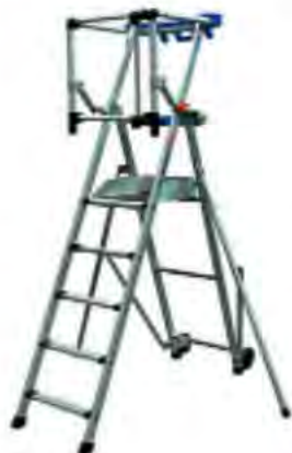
PLATE-FORME A HAUTEUR FIXE PERFORM

Aluminium, conforme au Décret 2004-924, Normes PIRL et EN131-7, labellisé NF, plancher antidérapant 0,50X0,40 m avec plinthes intégrées, charge utile 150 kg, autostable avec largeur produit optimale, roues diamètre 100 mm non marquantes, marches largeur 80 mm, protection arrière par garde-corps rigide et articulé et mise en place d'un seul geste, 2 tablettes de série avec compartiments : tablette supérieure grande capacité et 2 crochets porte-seau, poignée de transport intégrée, plus tablette inférieure adaptée pour fût de 15L, poids 15,7 kg.