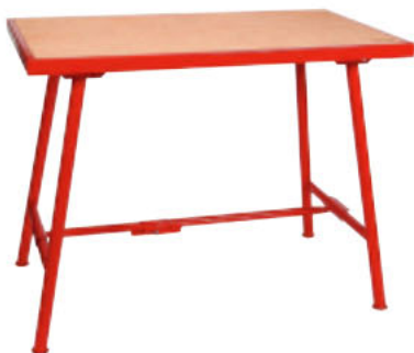
TABLE DE MONTEUR STANDARD 108 X 64 CM

Plateau en bois multiplis avec cadre en cornière métallique. Piètement en tube de Ø 40 mm. Facile à monter et à démonter. Construction très robuste pouvant supporter des poids élevés.