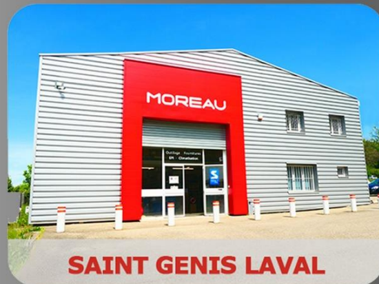
SAINT GENIS LAVAL

RETROUVEZ TOUTES NOS INFORMATIONS SUR NOTRE SITE INTERNET